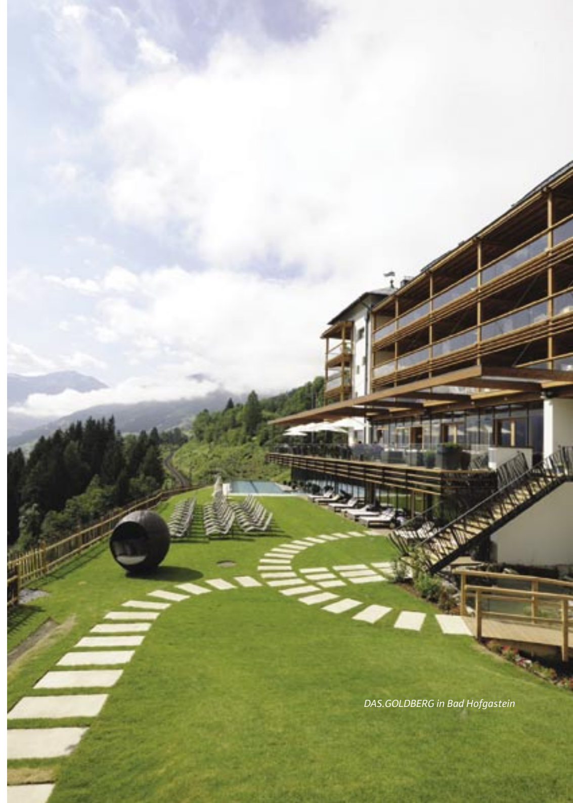
DAS.GOLDBERG in Bad Hofgastein

Im Vordergrund stehen die Funktion, der kommerzielle Nutzen eines Objekts sowie Persönlichkeit und Wünsche der Bauherrschaft. So entsteht die Herausforderung, an jedem Standort eine bauliche Struktur zu schaffen, welche sich eingliedert, trotzdem herausragt und zugleich nicht aufdringlich wirkt. Der Ansatz der W2MANUFAKTUR ist es, die architektonische Formensprache und die klare handwerkliche Ausformung der jeweiligen Region und deren Geschichte aufzunehmen und widerzuspiegeln. Ziel ist es, spezielle „Gasterlebnisketten“ im Bereich Architektur zu schaffen, die mehr als das bloße Visuelle, Auditive und Haptische befriedigen, gerne unter Einbindung der Geschichte einer Region, eines Grundstücks oder einer Familie. So entstehen spannende Dinge wie z.B. das Sternschnuppendach im Chaletdorf „Priesteregg“ oder die 6 m hohen Skulpturen im „DAS.GOLDBERG“, die den Mythen der Goldgräber nachempfunden sind.